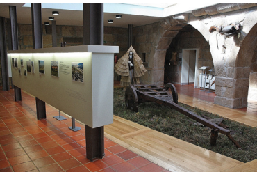
Pólo do Ecomuseu - Casa do Capitão