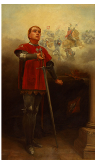
D. Nuno Álvares Pereira Pintura de Luciano Freire