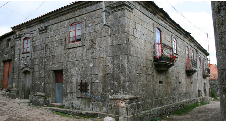
Casa Tradicional em Paredes