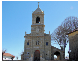
Igreja Matriz de Salto