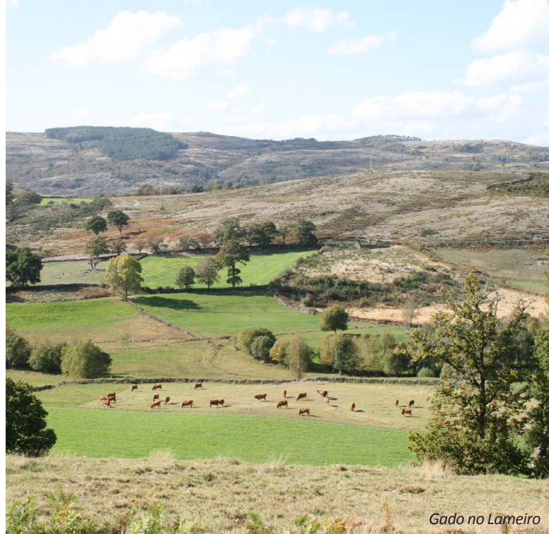
Gado no Lameiro

As áreas mais altas são cobertas por matos compostos por urse, carqueja, tojo e giesta, que são o suporte para o pastoreio de gado bovino e caprino. Nesta área ocorrem aves como a perdiz, melro-preto, falcão, lavandeiras, andorinha e pombo.