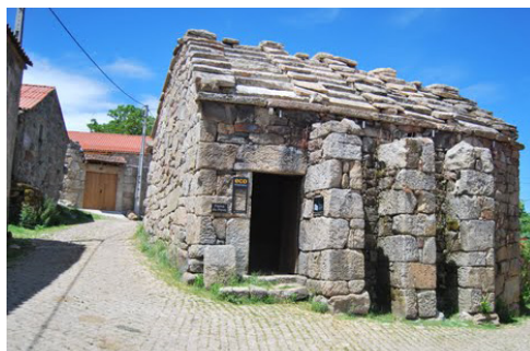
Forno Comunitário de Tourém